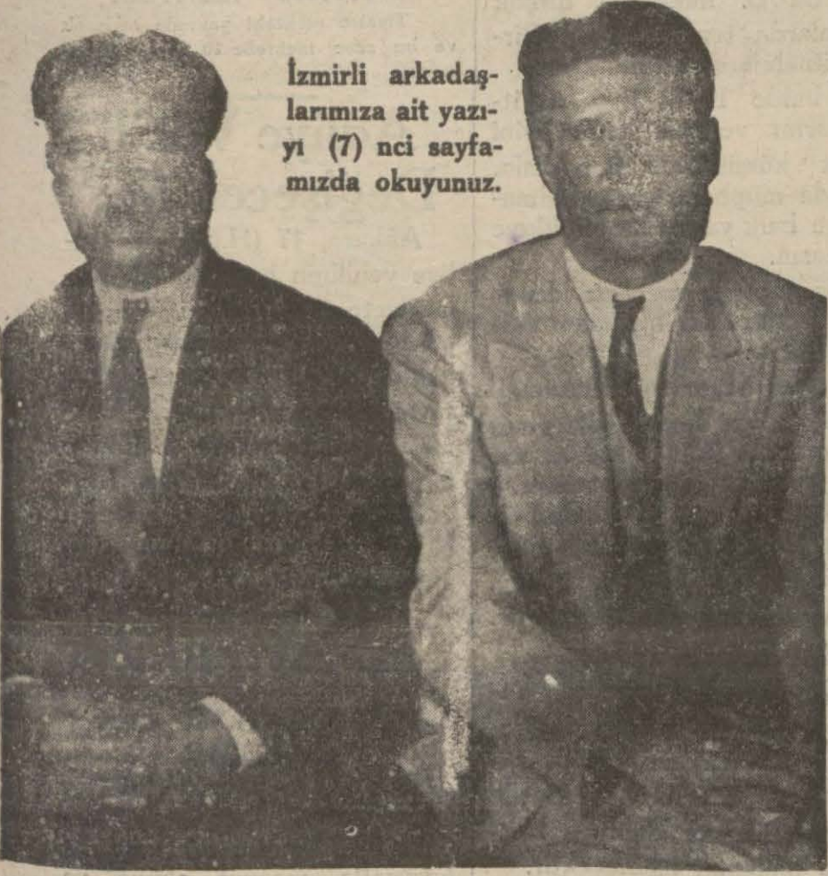
İzmirli arkadaşlarımızımıza ait yazıyı (7) nci sayfamızda okuyunuz.